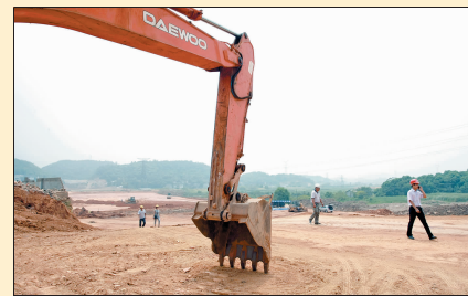
▶▶▶▶ 详见 T3 版