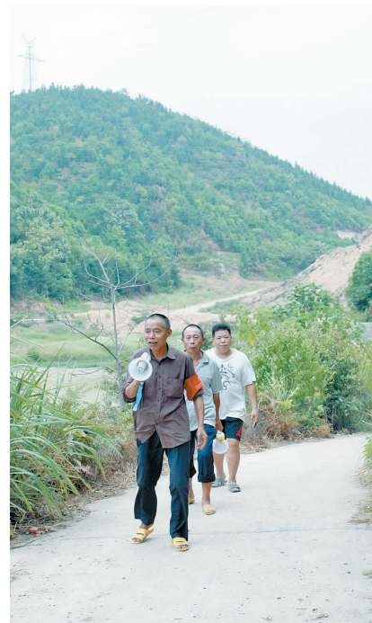
各村组织的防火巡逻队,正严密巡查安全隐患。

“把工作思路向惠民富民汇集,把工作措施向为民利民凝聚,把工作作风向亲民爱民转变,不断提高新形势下做好群众工作的能力,办成一批顺民意得民心惠民生的实事好事。”吴新琼说,这才是昭山示范区开展群众路线教育实践活动的出发点和目的。