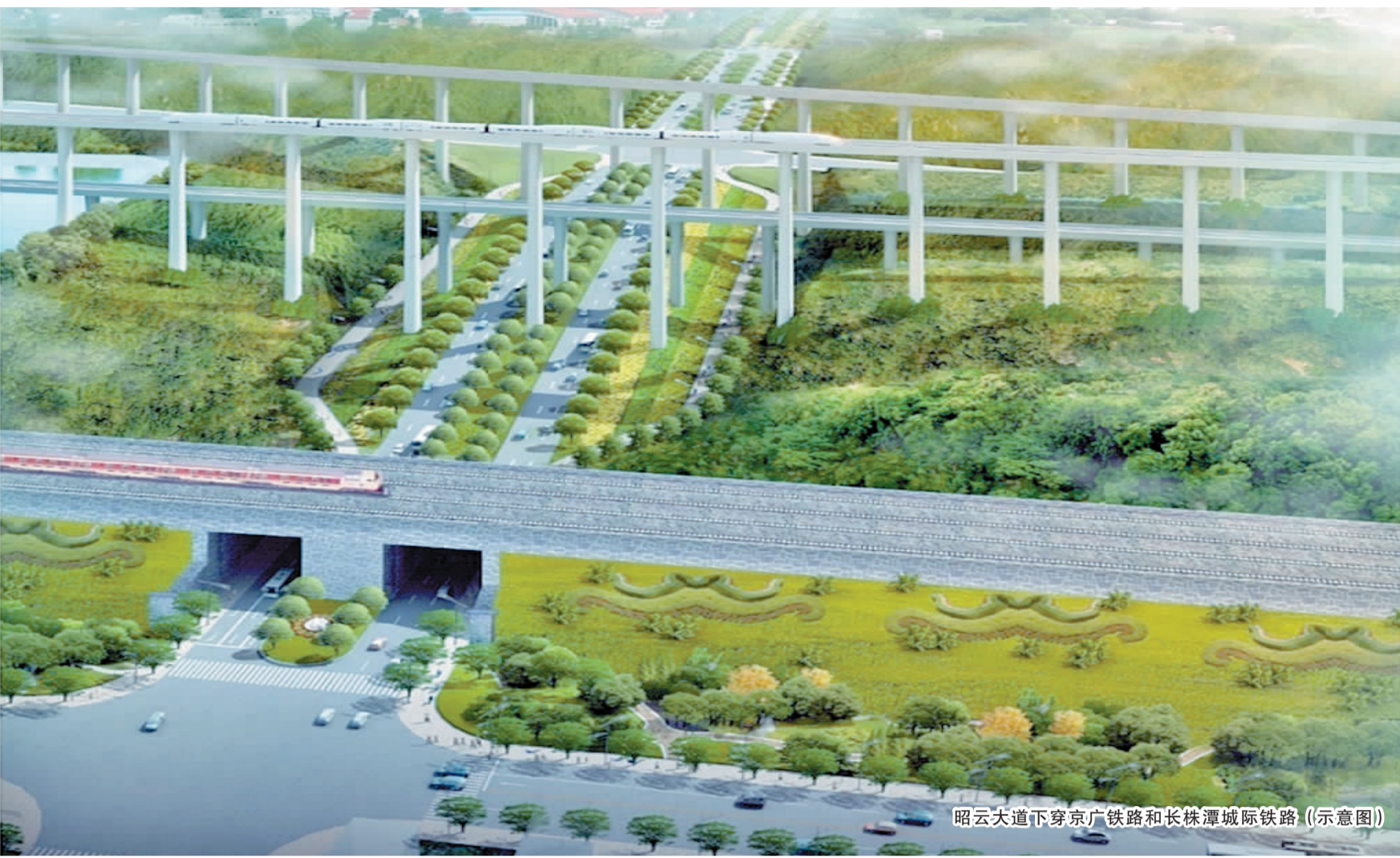
昭云大道下穿京广铁路和长株潭城际铁路(示意图)