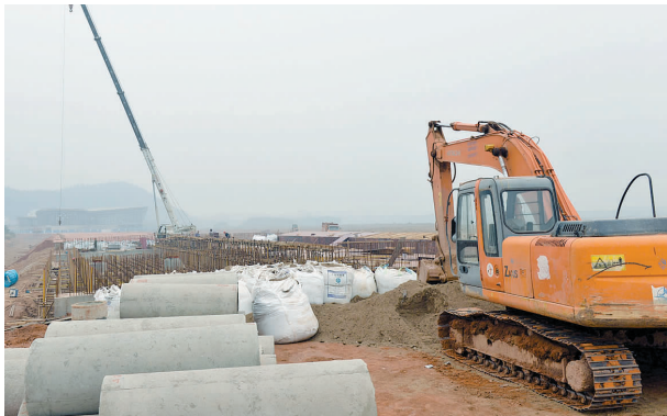
地下管道工程进入紧张施工期。