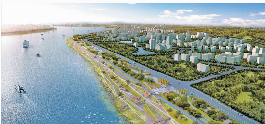
昭山湘江风光带鸟瞰图(效果图)。

坚持高起点、高标准规划建设,兼顾园区近、远期发展所需,昭山示范区投入近20亿元的路网工程进展喜人:一期道路工程昭山大道、昭华大道、白合大道(二期)、昭云大道、金南路全面开工建设,已完成路基16.68公里。二期道路工程清水路、昭山大