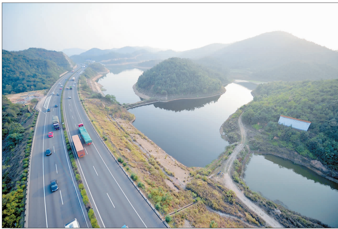
昭山风光